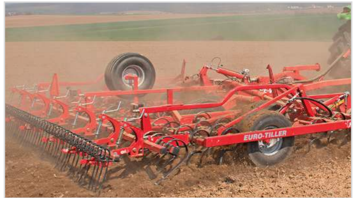
6,00 m Euro-Tiller m/ förharv, Spring-Board fjäderpinnsplanka, Spring-Board efterharv, långfinger-efterharv och reservhjul.