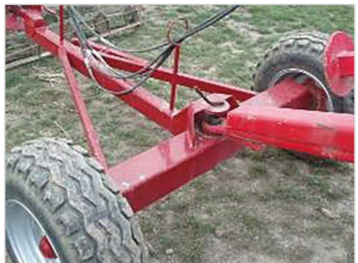
Dolly: hjulsätt som möjliggör tillkoppling av vält efter harven - 11,5/80 x 15,3 hjul.