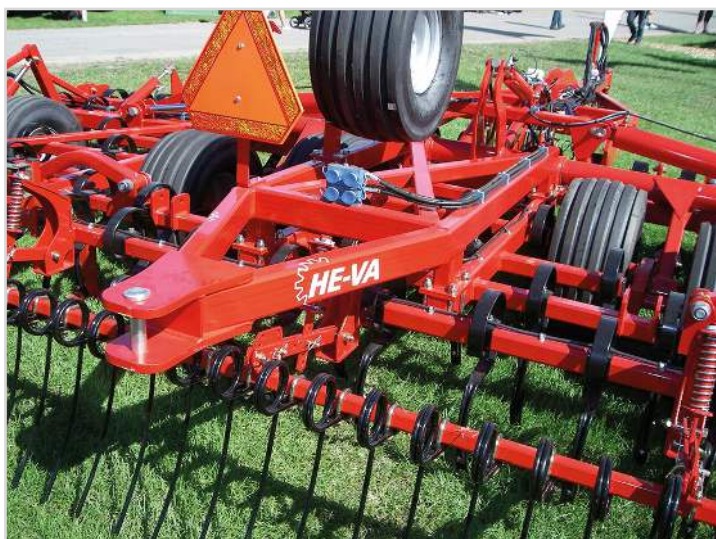
Euro-Tiller med drag för t.ex ringvält.