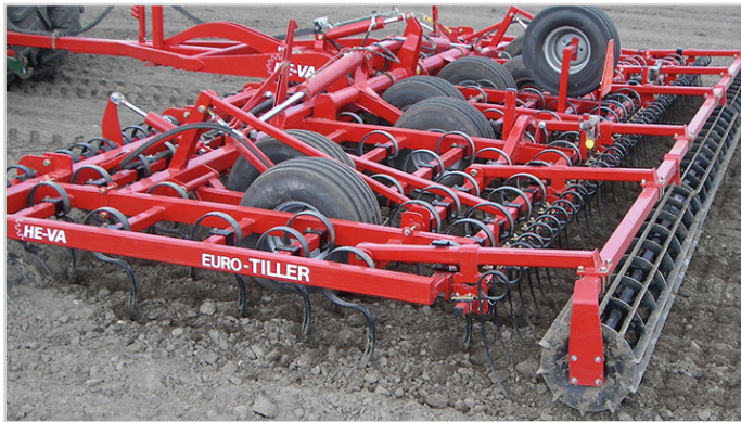
8,00 m Euro-Tiller m/ Spring-Board plank, vals inkl. långfinger-efterharv och reservhjul.